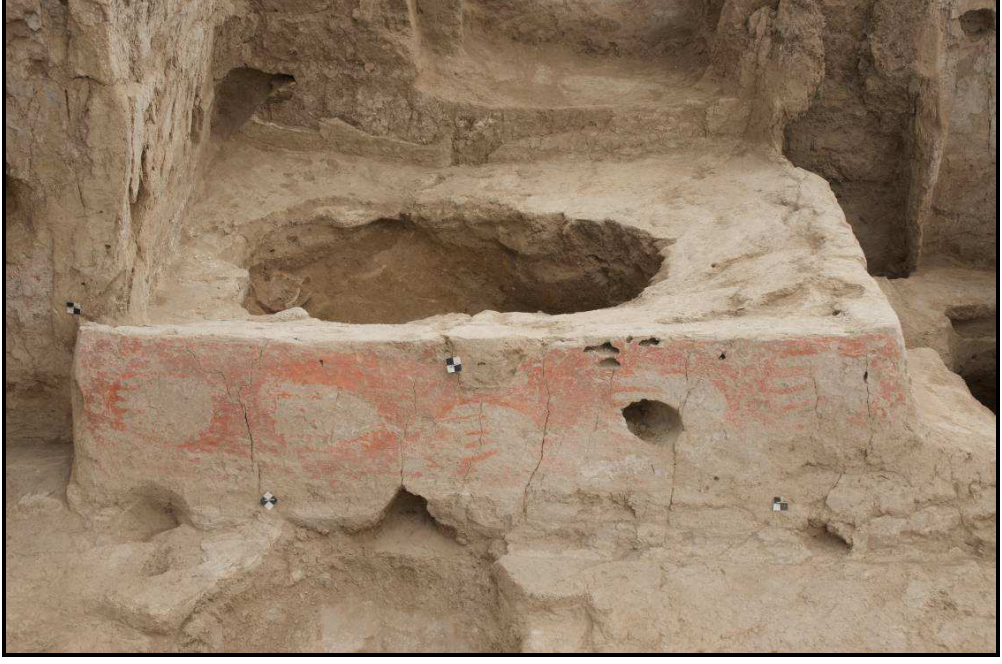
4040 alanındaki elle yapılmış kırmızı boyalı sıva

Çatalhöyük'te hem 1960'lardaki hem de 1990'lardaki kazılar hayvanlar ile ne tamamıyla hayvan ne de insan olan stilize edilmiş figürleri betimleyen heykelcikleri açığa çıkarmıştır. İnsan biçimindeki figürler daha çok bilinirken, figürlerin çoğu hayvan figürüdür ve alanın tüm tarihçesi boyunca uzanmaktadır. Öküz, domuz, koyun, keçi, ayı ve canids ile birlikte müstakil boynuzlar da tespit edilmiştir. Taştan veya pişmiş kilden dikkatlice yapılmış bazı heykelciklerde insan figürleriyle bağlantılandırılmış leoparlar veya kedigiller de görülmektedir. Çatalhöyük'teki heykelciklerin çoğu küçük, çabuk yapılmış ve sonrasında çöpe atılmıştır. Bu heykelciklerin günlük hane içi kullanım da dahil birçok farklı kullanım alanı olduğu sanılmaktadır (Meskell 2007).