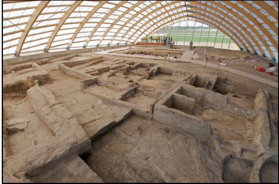
4040 Korugandaki kazılardan genel bir görünüş