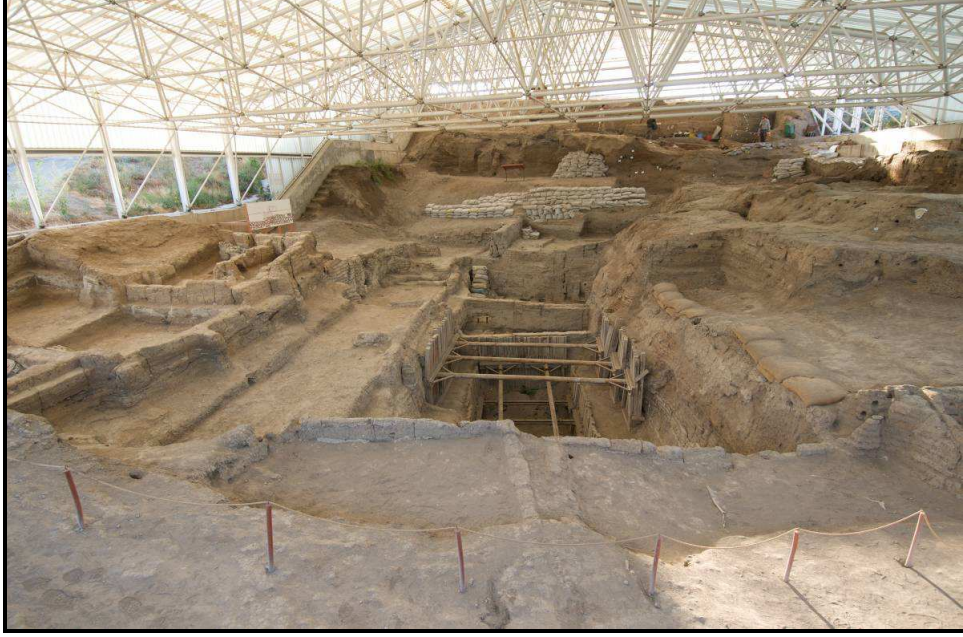
Güney Koruma Örtüsünden bir görünüş.

çevreleme, BACH ve Alan 4040 kazılarıyla) çağdaş binalar arasında eski gömü evlerini paylaşan küçük ev yığınlarının yanında ortak alanların birleştirdiği büyük ölçekli yapı gruplarını ortaya koymaktadır.